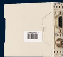
INSYS GSM Small